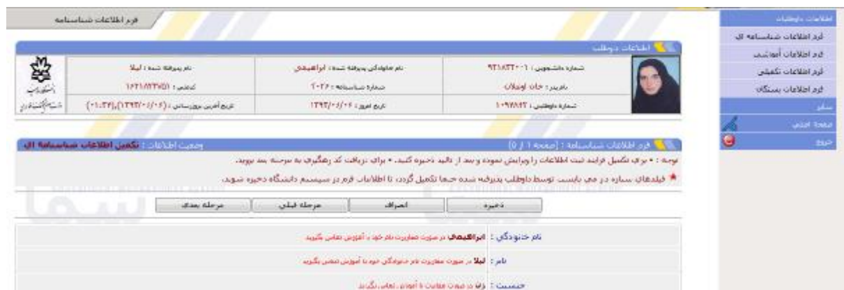
شکل 3- صفحه فرم اطلاعات شناسنامه ای

در این صفحه با انتخاب گزینه فرم اطلاعات شناسنامه ای، صفحه فرم اطلاعات شناسنامه ای مطابق شکل 3 نشان داده می شود: