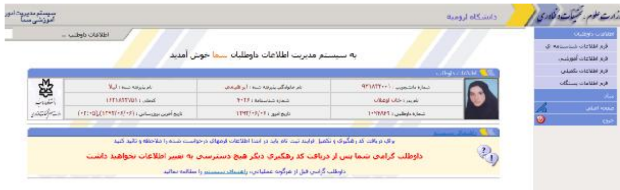
شکل 2- صفحه اولیه سیستم پس از ورود

در این صفحه با انتخاب گزینه فرم اطلاعات شناسنامه ای، صفحه فرم اطلاعات شناسنامه ای مطابق شکل 3 نشان داده می شود: